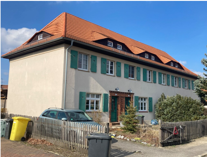
Zweigeschossiges, traufständiges Mehrfamilienwohnhaus, Variation eines Bautyps der Siedlung, Blick von Süden