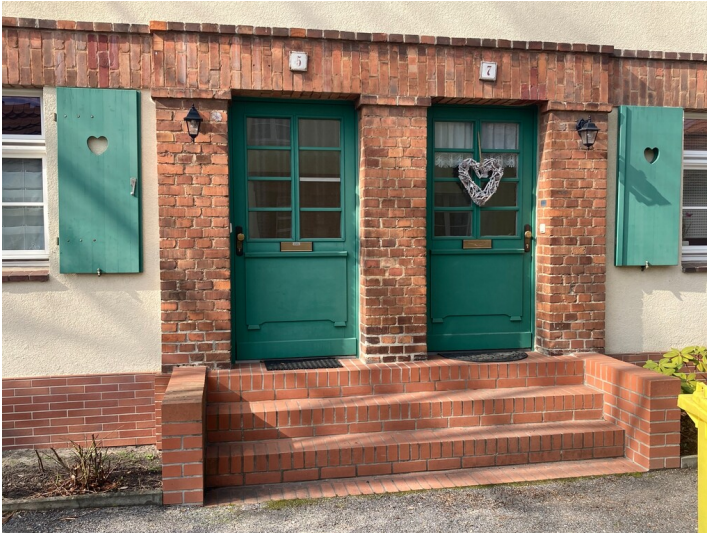
Zweigeschossiges Mehrfamilienwohnhaus der Gartenstadtsiedlung Lautanord, Eingangsdetail