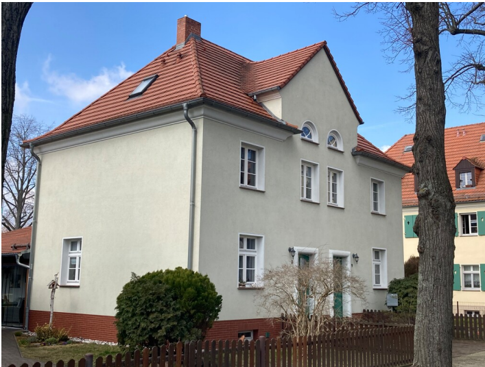
Nr. 8 und 9 von Südosten