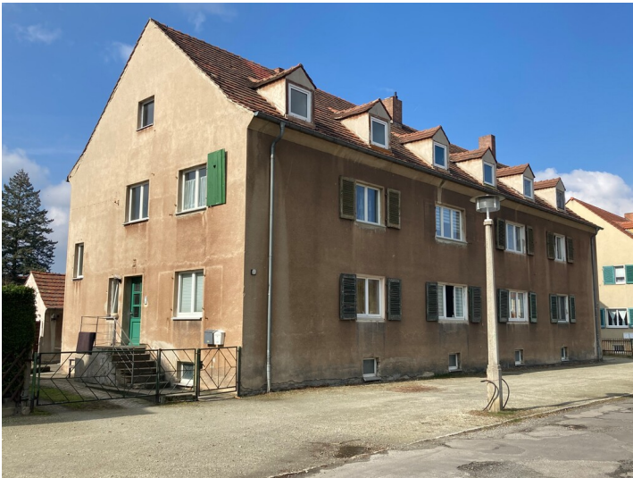
Wohnhaus mit Ostfassade zum Markt