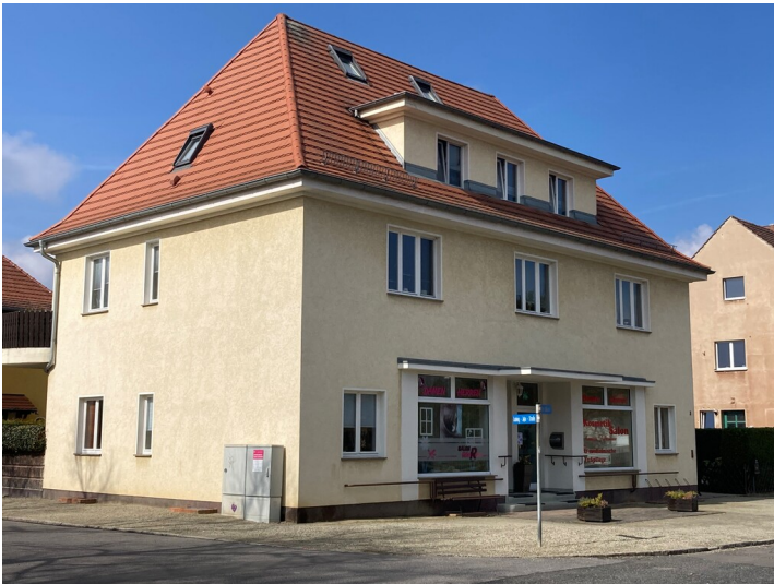
Wohn- und Geschäftshaus Markt 3, vom Markt aus gesehen