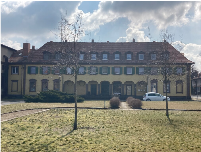
Wohn- und Geschäftshaus Markt 1 und 2, Schauseite zum Markt