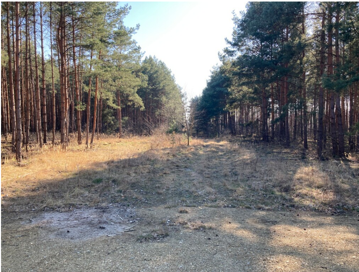
abgetragener Damm der 900 mm-spurigen Kohlebahn der »Ilse Bergbau-A.G.«, Strecke Kortitzmühle-Senftenberg, im Bereich der Kortitzmühle