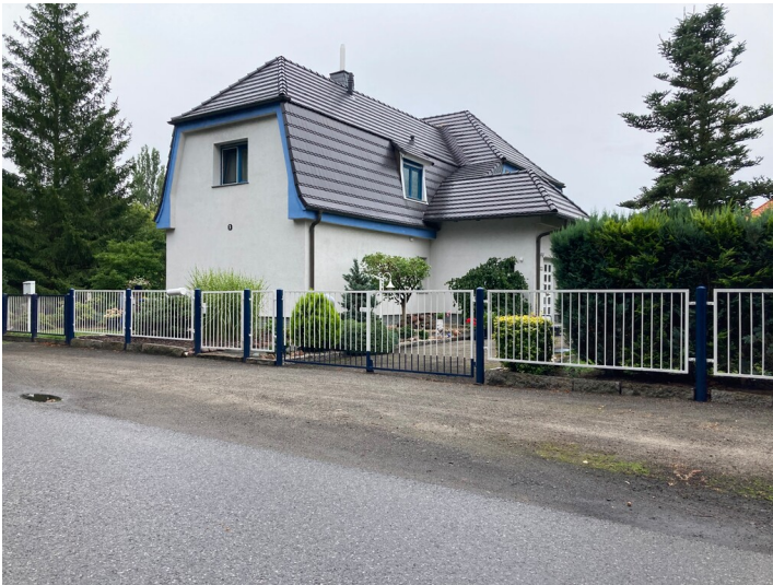
Einfamilienwohnhaus Lohsaer Weg 1, Ansicht von Norden