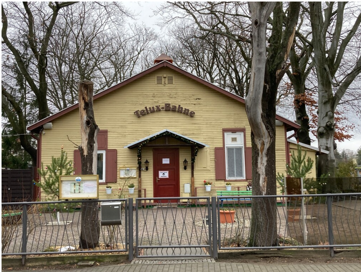
Kegelbahn, Kopfbau von Südosten