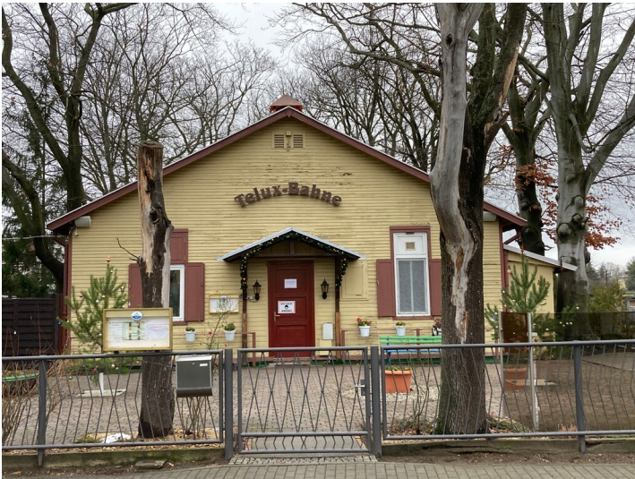
Kegelbahn, Kopfbau von Südosten