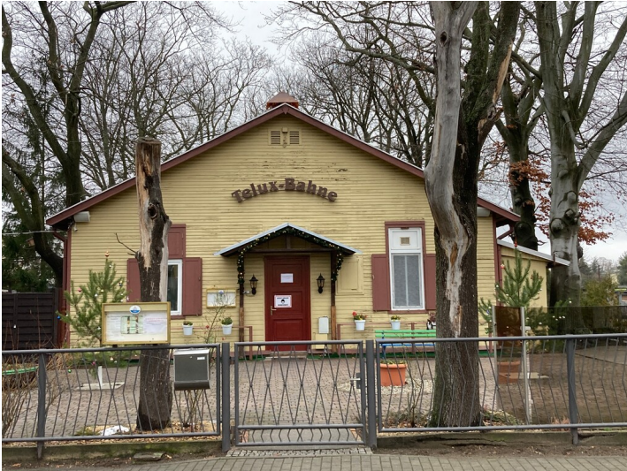
Kegelbahn, Kopfbau von Südosten