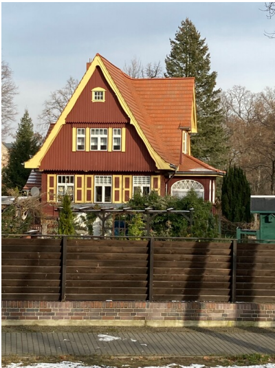
Villa, Holzhaus im Heimatstil, Ansicht von Süden/Rosa-Luxemburg-Straße