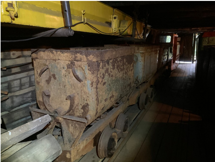
Kippförderwagen 9, 10, 11, 12, 13 und 14 in der Untertagestrecke