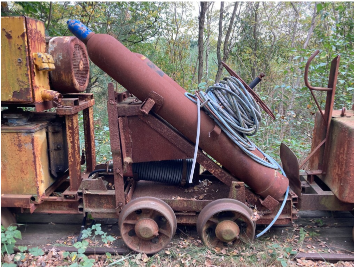
Spezialwagen für Autogenschweißanlage und Zubehör