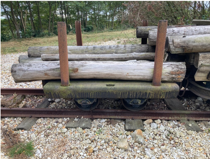
Plattformwagen mit Rungen, Bauform 2