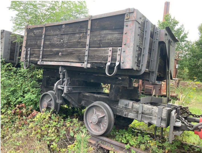
Fünf Abraum-Holzkippwagen (Nr. 2072, 3354, 3533, 3363, 2408), wohl die letzten erhaltenen ihrer Art in Deutschland