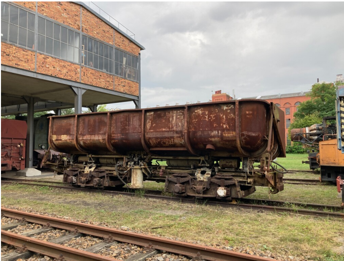
Einseiten-Kastenkipper 25 m 3