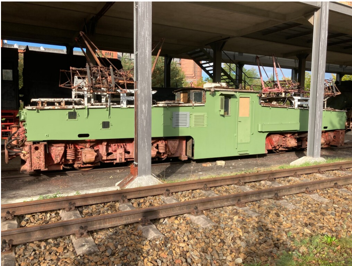
Ellok EL3 4-96-75-A2, sogenannte 75-Tonnen Lok, bei LEW Hennigsdorf 1954 gebaut