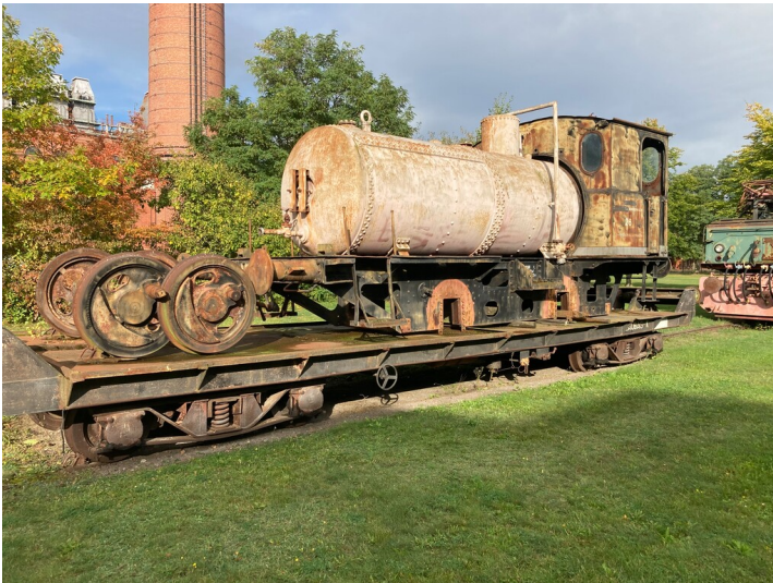
Dampfspeicherlokomotive HANOMAG (Torso), auf Flachwagen, zuletzt verwendet als Löschwasserreservoir