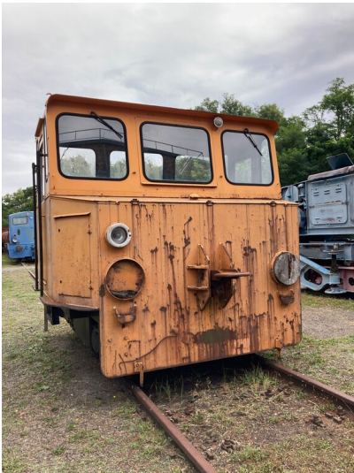
Akkuschleppfahrzeug ASF EL 16, LEW Hennigsdorf, Fabr.-Nr. 20684/ 1990