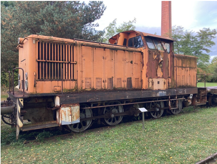
Dieselhydraulische Rangierlokomotive V60/ BR 106, LAUBAG Betr.-Nr. 106-23