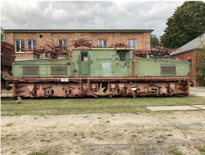
Ellok EL2 4-662-100-B3