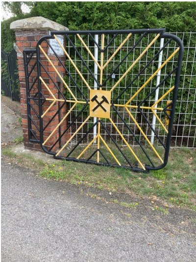
Eingang mit Tor in individueller Schlosserarbeit