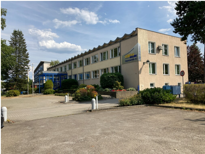
Verwaltungsbau im Wohnkomplex III

Schlagwörter: Bürogebäude Fachsicht(en): Denkmalpflege Gemeinde(n): Hoyerswerda Kreis(e): Bautzen Bundesland: Sachsen