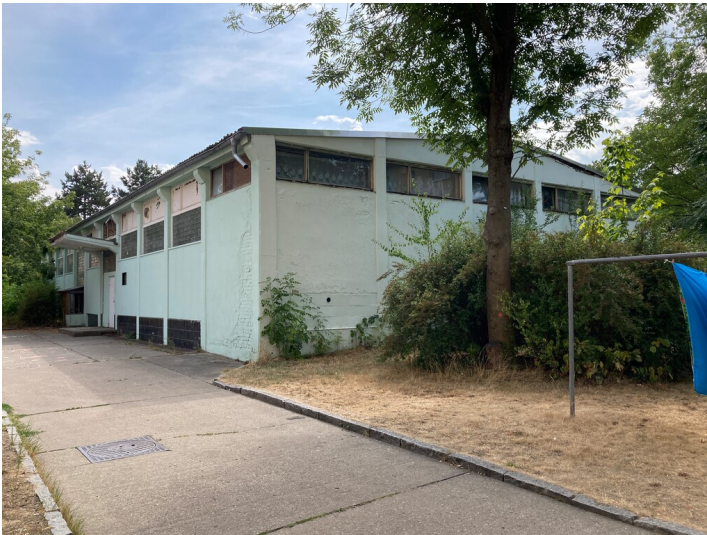
ehem. Kaufhalle im Wohnkomplex III