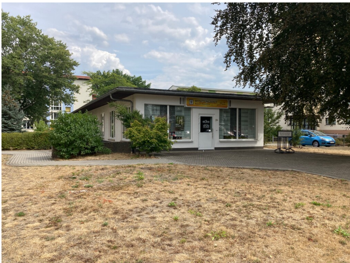
Verkaufspavillons im Wohnkomplex III