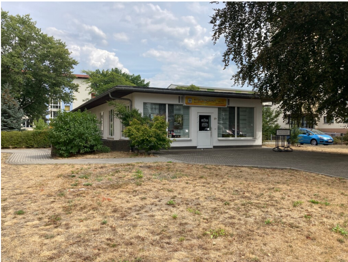
Verkaufpavillons im Wohnkomplex III