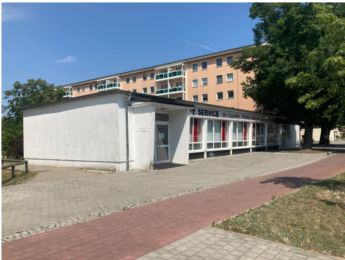
Verkaufspavillon im Wohnkomplex II