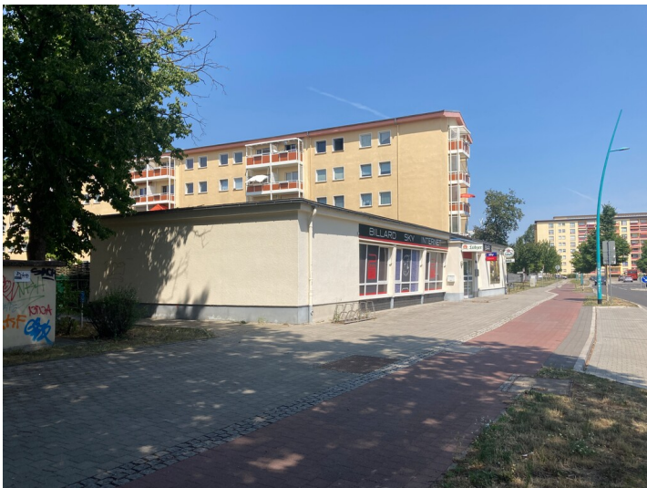
Verkaufspavillon im Wohnkomplex II