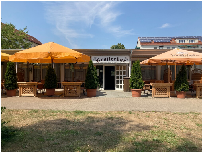
Wohngebietsgaststätte Wohnkomplex II