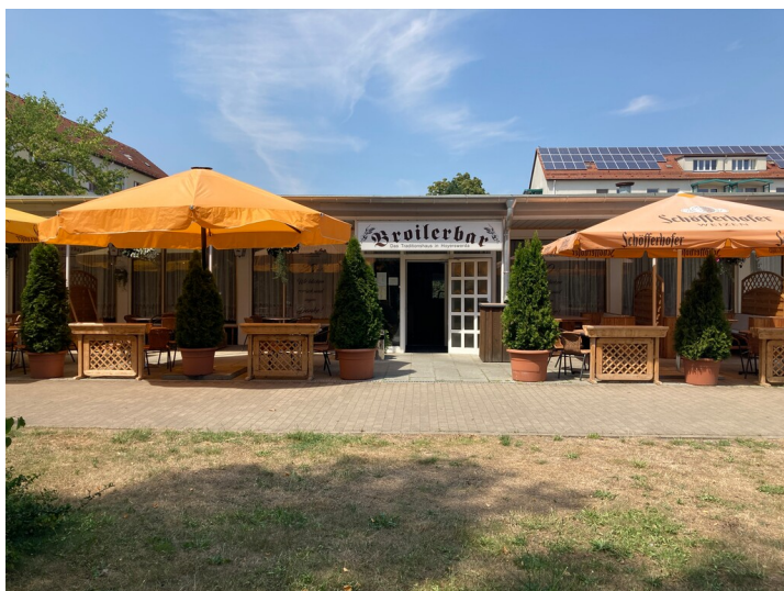
Wohngebietsgaststätte Wohnkomplex II