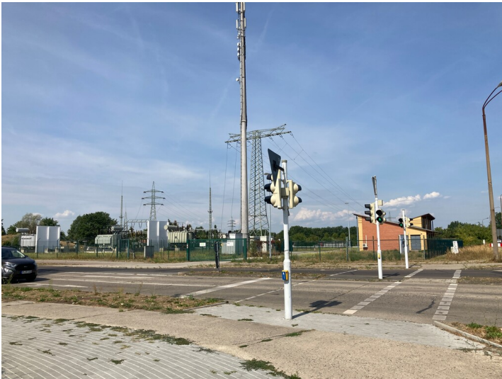
Umspannwerk Hoyerswerda

Schlagwörter: Umspannwerk Fachsicht(en): Denkmalpflege Gemeinde(n): Hoyerswerda Kreis(e): Bautzen Bundesland: Sachsen