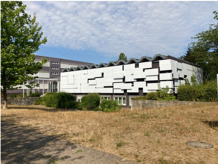
Bürogebäude im Wohnkomplex I