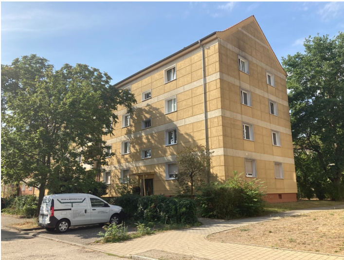
Wohnblock Otto-Damerau-Straße 2; 4; 6; 8; 10