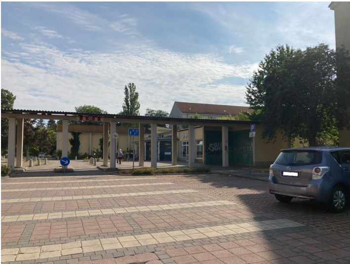
Wohngebietszentrum Wohnkomplex I in Hoyerswerda