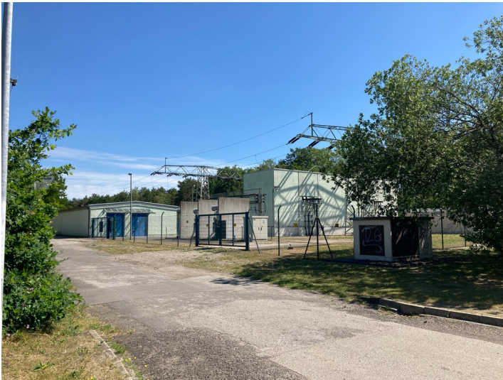
Umspannwerk Bernsdorf