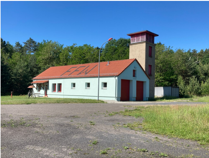
Werkfeuerwehr der ehem. Brikettfabrik Zeiholz