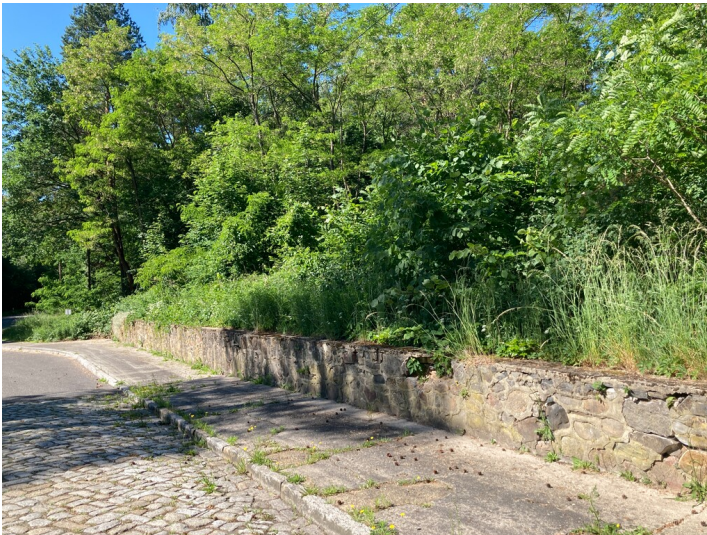
Einfriedung der ehem. Brikettfabrik Zeiholz