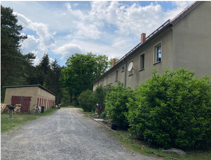
Mehrfamilienhaus in der ehem. Werksiedlung Saxonia