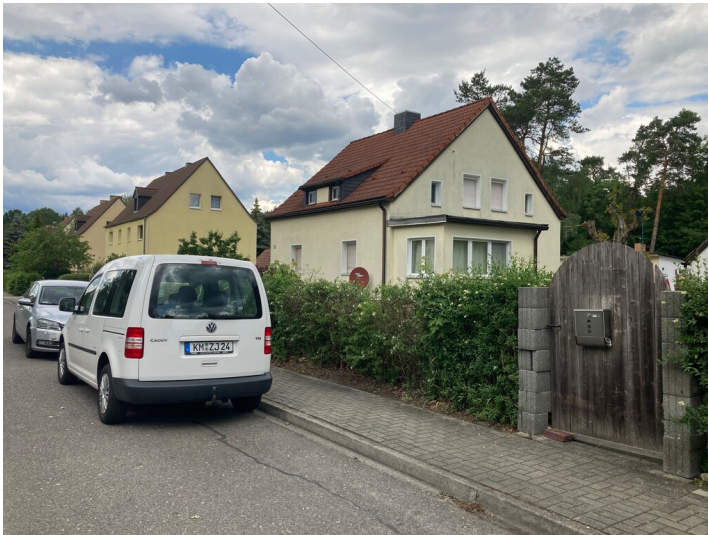
Einfamilienwohnhaus der ehem. Werksiedlung Heye III