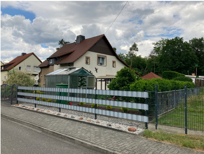
Doppelwohnhaus der ehem. Werksiedlung Heye III