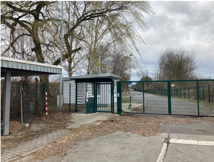
Kläranlage Ost Schwarze Pumpe

Schlagwörter: Kläranlage Fachsicht(en): Denkmalpflege Gemeinde(n): Spreetal Kreis(e): Bautzen Bundesland: Sachsen