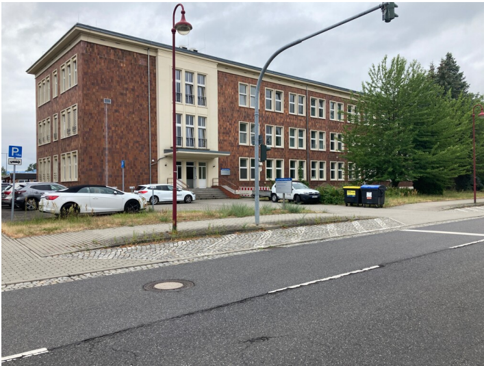
Technischer Service Schwarze Pumpe