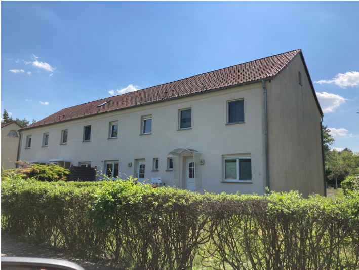
Mehrfamilienwohnhaus in Spreetal