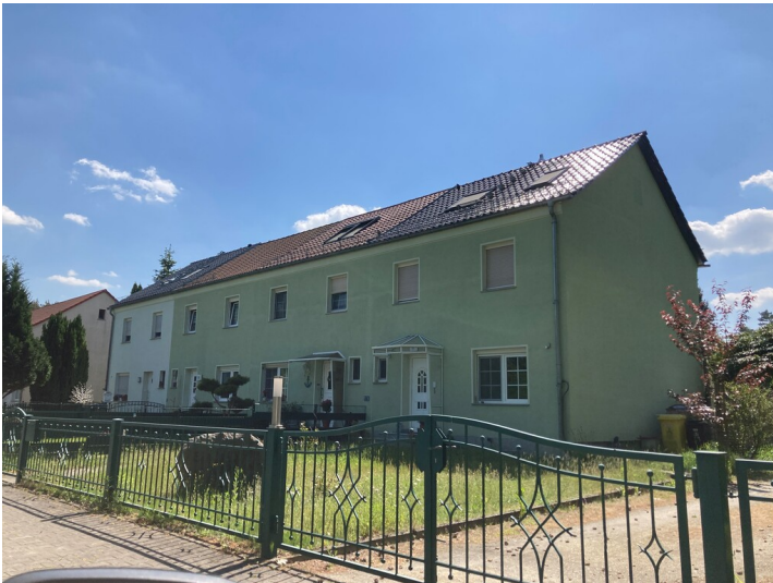
Mehrfamilienwohnhaus in Spreetal