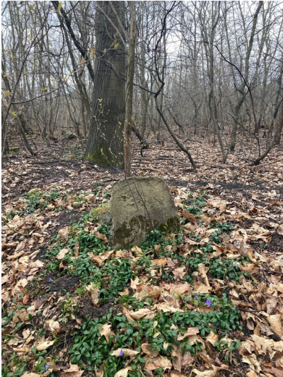
Denkmal für den Pumpenwärter August Puschmann