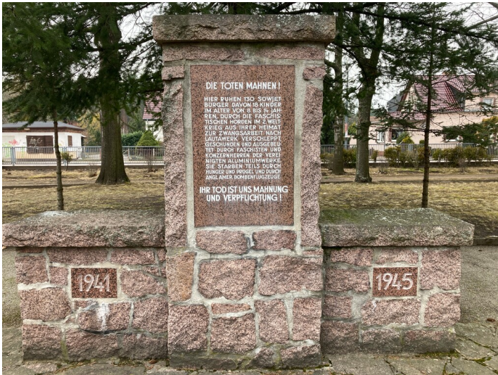
Ehrenmal für sowjetische Gefangene auf dem Friedhof in Lauta