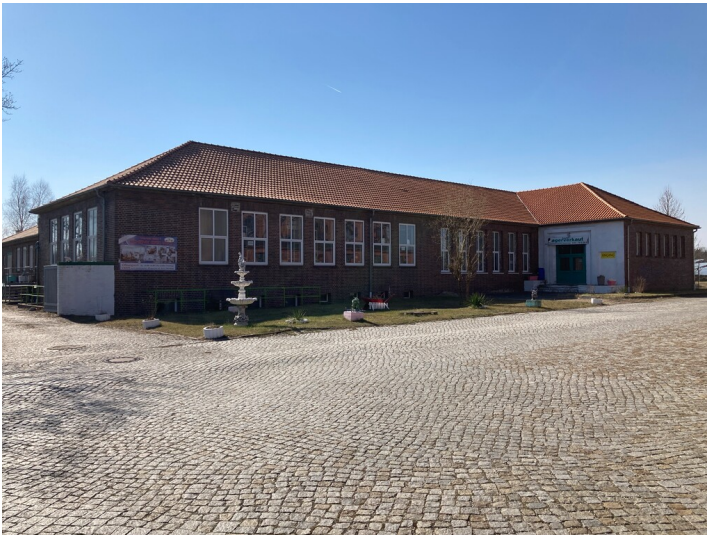
Werksküche der ehemaligen Brikettfabrik der Grube Erika