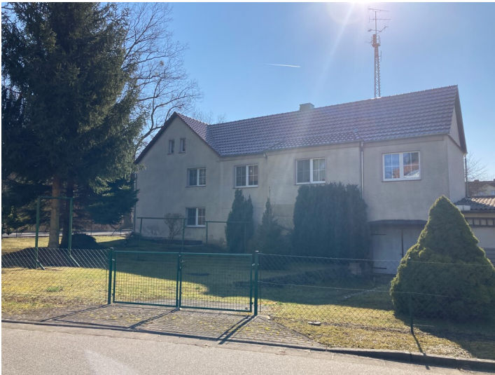
Siedlungshaus in der Kolonie Bergmannsheimstätten