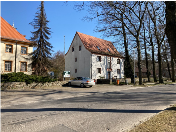
Mehrfamilienwohnhaus in der Kolonie Bergmannsheimstätten