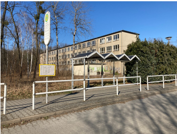
ehem. Polytechnische Oberschule "Kurt Krjenc" in Laubusch; heute Kindergarten