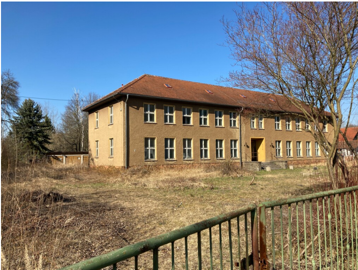
ehem. Gemeindecindergarten der Bergmannsheimstätten