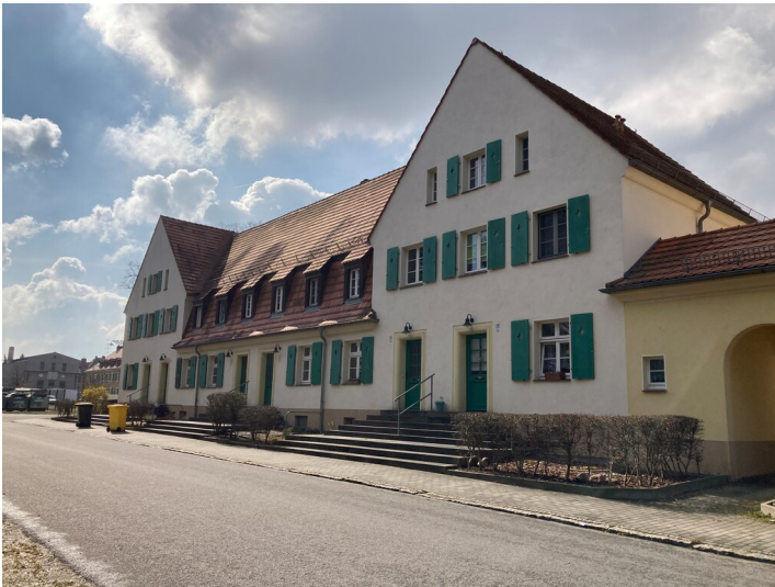
ehem. Arbeiterwohnhaus der Gartenstadt Lauta-Nord