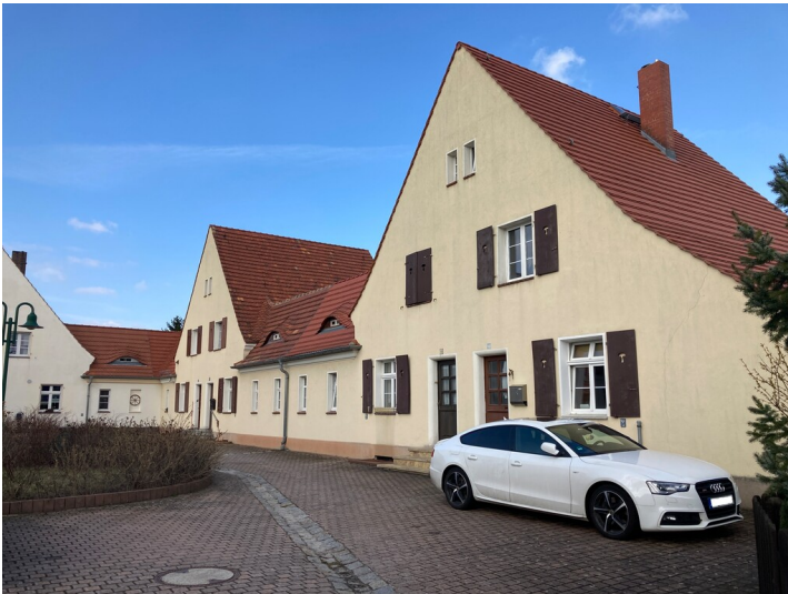
ehem. Arbeiterwohnhaus in der Gartenstadt Lauta-Nord